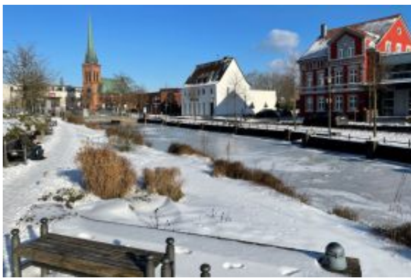
Foto oben rechts: Das Jüdische Museum Westfalen hält die jüdische Geschichte lebendig